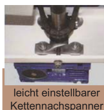
leicht einstellbarer Kettennachspanner