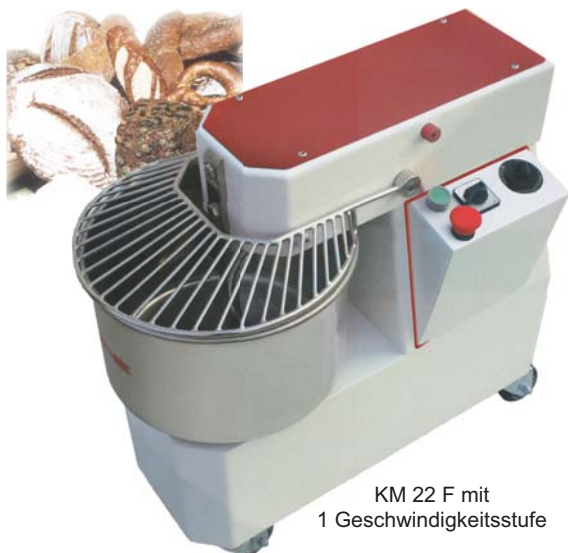
KM 22 F mit 1 Geschwindigkeitsstufe