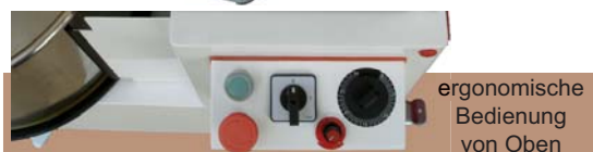
ergonomische Bedienung von Oben