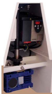
KM.../VS mit Inverter für stufenlose Geschwindigkeitsregelung und Motoroptimierung für 230 Volt Anschluß