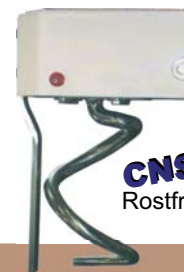
Knethaken mit Teigbrecher für kleinere Teigmengen