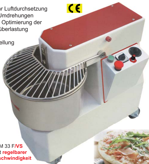
KM 33 F/VS mit regelbarer Geschwindigkeit