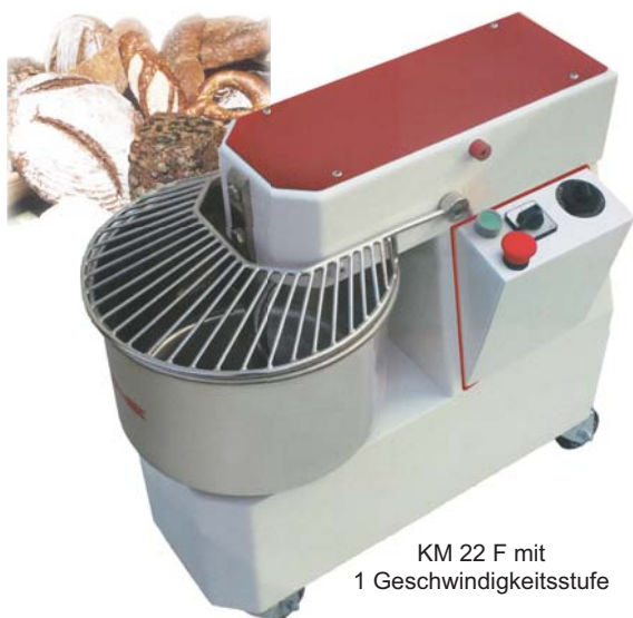
KM 22 F mit 1 Geschwindigkeitsstufe