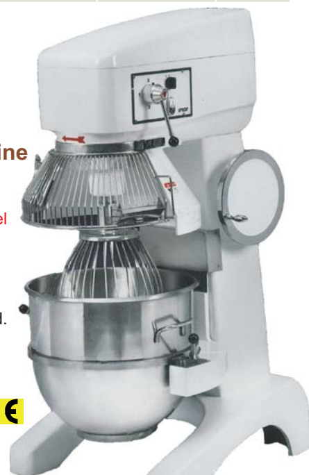
PTM 60 F