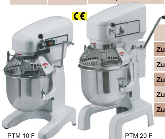
PTM 10 F