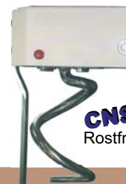
Knethaken mit Teigbrecher für kleinere Teigmengen