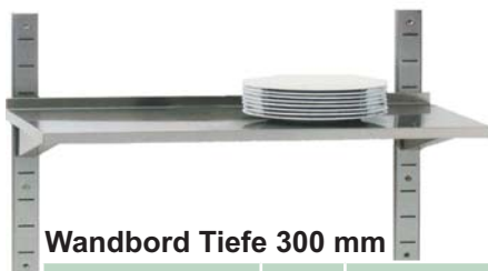
Wandbord Tiefe 300 mm

Alle Wandborde komplett aus Edelstahl in Tiefe 300 und 400 mm, mit Aufkantung und 2 Wandkonsolen (Länge 600 mm). Eckbord für die saubere Ecklösung