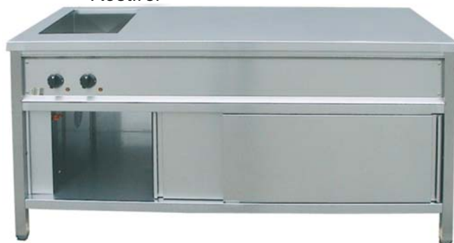
Wärmeschrank WS7160 mit Einbau Bain Marie EBM 1/1

Wärmeschrank / DURCHREICHESCHRANK 700 mm Tiefe, mit beidseitigen Schiebetüren, Zwischenboden und Arbeitsplatte ohne Aufkantung hinten , 2,5 kW, 240 V ⚡