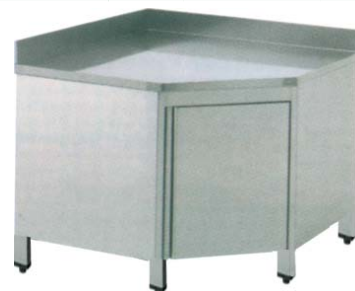
Eckarbeitsschrank mit Türe, Zwischenboden und Arbeitsplatte mit Aufkantung hinten