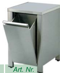
Abfallkipper mit Arbeitsplatte ohne Aufkantung hinten