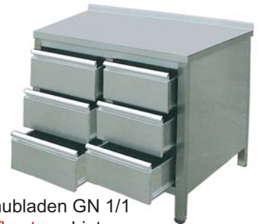
Arbeitsschrank mit 6 Schubladen GN 1/1 und Arbeitsplatte ohne Aufkantung hinten