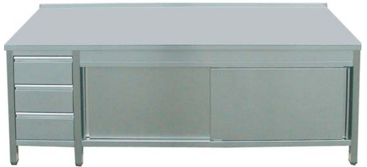
Arbeitsschrank 700 mm Tiefe, mit 3 Schubladen links , Schiebetüren, Zwischenboden und Arbeitsplatte ohne Aufkantung hinten