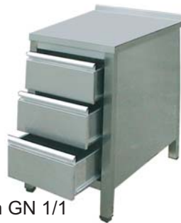
Arbeitsschrank mit 3 Schubladen GN 1/1 und Arbeitsplatte ohne Aufkantung hinten