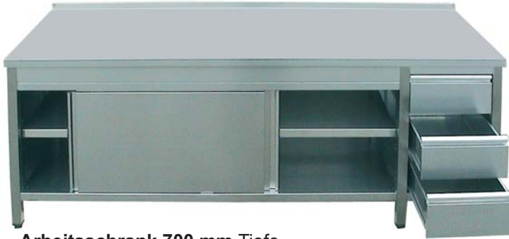
Arbeitsschrank 700 mm Tiefe, mit 3 Schubladen rechts , Schiebetüren, Zwischenboden und Arbeitsplatte ohne Aufkantung hinten

Alle Arbeitsschränke komplett aus Edelstahl, mit Schiebetüren und Schubladen (in Doppelwandausführung) sowie verstellbarem Zwischenboden. Arbeitsplattenhöhe 40 mm mit wasser- und feuerabweisender beschichteter Holzunterfütterung für maximale Stabilität, mit oder ohne Aufkantung, verstellbare Füße (Höhe 150 mm). Stabiler Tischaufbau aus selbsttragenden 4-kant Formrohre 40 x 40 mm